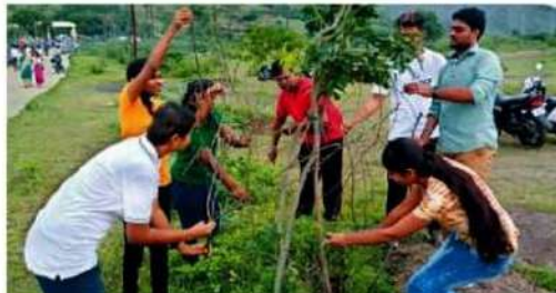
औरंगाबाद में विवाह को युवा शक्ति मंच की ओर से हिमायत बाग में पेड़ों को राखी बांधने का कार्यक्रम आयोजित किया गया. दूसरे छायाचित्र में 'प्रयास' ग्रुप की ओर से पेड़ों को राखी बांधते युवा.

जाने-आने के दौरान छोटे और बड़ों के माथे पर लाल तिलक और हाथ पर राखी नजर आ रही थी. घर-घर में देर रात तक भोजन और गपशप का दौर जारी रहा मंदिरों में राखियां चढ़ाई पहिलानों में परिसर के मंदिरों में जाकर सदगुरुओं को राखियां अर्पित कीं. इन्होंने के स्वामी समर्थ सेवा केंद्र में शाम की आली के पश्चात सेवाकर्ता महिलाओं ने स्वामी समर्थ महाराज की प्रतिमा के सामने 'देव' राखियां अर्पित कीं.