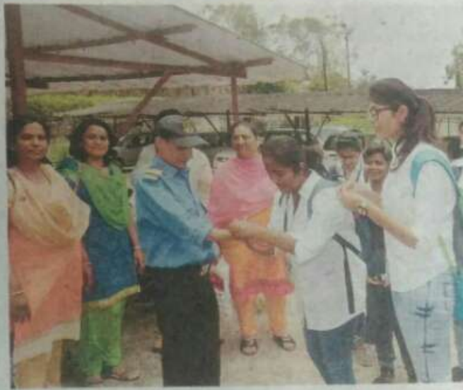
में किलेअर्क स्थित शासकीय ज्ञान विज्ञान महाविद्यालय के राष्ट्रीय सेवा योजना विभाग की छात्राएं विभिन्न स्थानों पर कार्यरत लोगों को राखी बांधकर उन्हें अपनेपन का एहसास कराती हुईं.