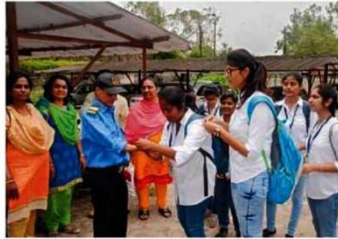
औरंगाबाद में विवाह को रक्षाबंधन के अवसर पर सेवन दिन परिसर में राखी बांधती हुई एक बालिका, दूसरे चित्र में किर्लोस्कर विश्व शास्त्रीय ज्ञान विज्ञान महाविद्यालय के राष्ट्रीय सेवा योजना विभाग की छात्राएं विभिन्न स्थानों पर कार्यरत लोगों को राखी बांधकर उन्हें अपनेपन का एहसास कराती हुईं.