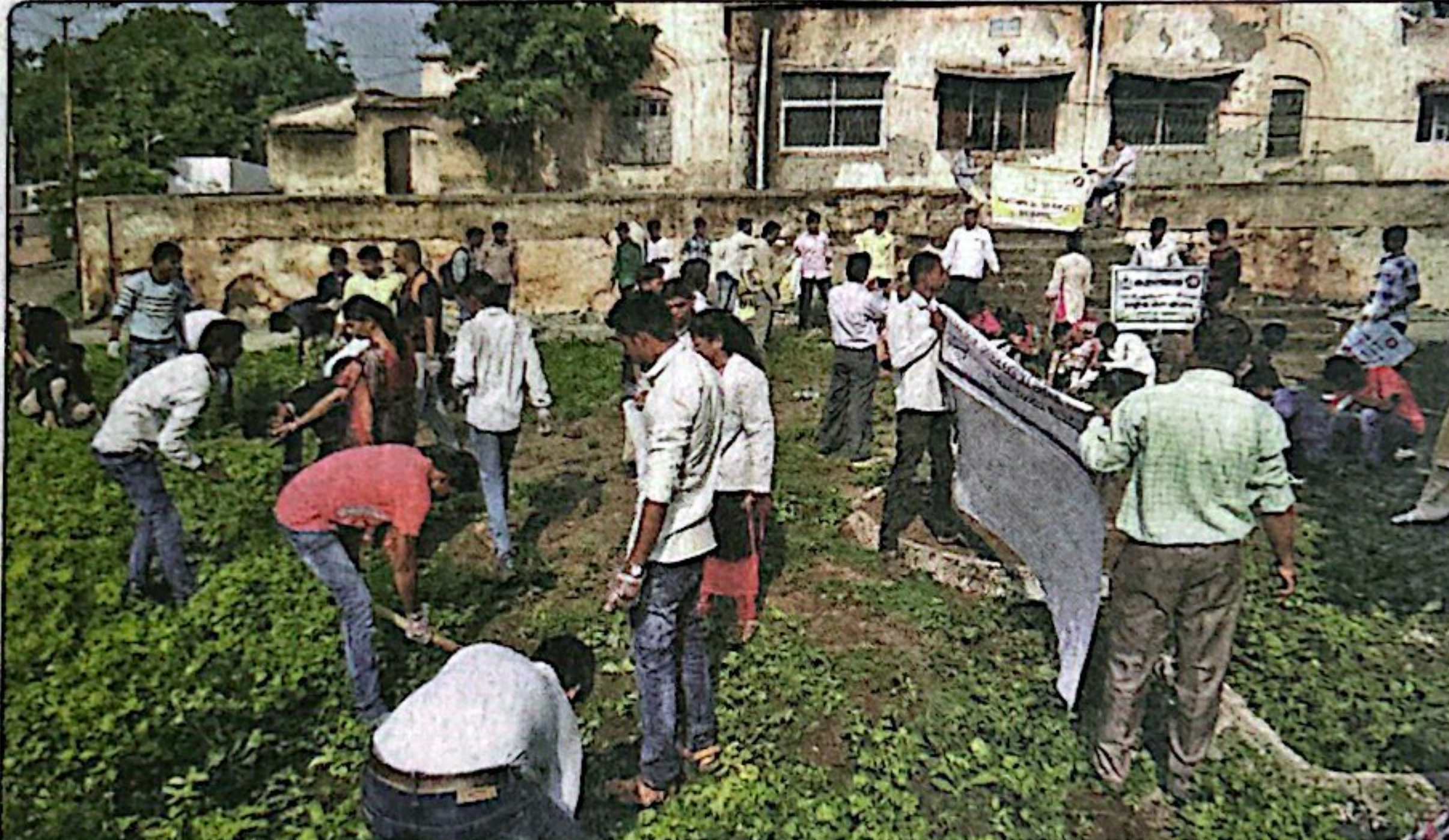
ऐतिहासिक वास्तूच्या स्वच्छतेसाठी कॉलेजच्या विद्यार्थ्यांनी किलेअर्क परिसरातील साफसफाई केली.

पर्यटनस्थळांना भेट देण्यासाठी देश-विदेशातील लाखो पर्यटक येतात. अनेक प्रेक्षणीय पर्यटनस्थळांच्या परिसरातील अस्वच्छता दिसते. पर्यटनस्थळांच्या परिसरात बाटल्या, पिशव्या, दारूच्या बाटल्या पडलेल्या आढळतात. पर्यटनस्थळांची नियमित साफसफाई होत नसल्याने दुर्गंधही पसरते. ऐतिहासिक वास्तूंच्या स्वच्छतेची जबाबदारी तरुणांनी आपल्या खांद्यावर घेतली आहे. डॉ. बाबासाहेब आंबेडकर मराठवाडा विद्यापीठाच्या रासेयोचे हे स्वयंसेवक आहेत. विविध कॉलेजच्या हे विद्यार्थी प्रत्येक रविवारी एका ऐतिहासिक वास्तू परिसरातील साफसफाई करत वास्तू जतन करण्याचे संदेश देतात. या रविवारी ही तरुणाई सुभेदारी विश्रामगृहाच्या परिसरात एकवटली. सकाळी ६ ते १० वेळेत शासकीय ज्ञान विज्ञान कॉलेजच्या परिसरातील मर्दाना महल, आदिल दरवाजा, शाही मजिद या ऐतिहासिक वास्तूंच्या परिसरातील साफसफाई केली. विविध कॉलेज, अभ्यासक्रमाचे ३९० विद्यार्थी यात सहभागी झाले होते.