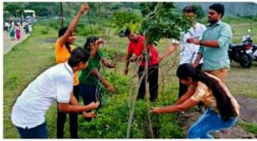
औरंगाबाद में विवाह को युवा शक्ति मंच की ओर से हिमायत बाग में पेड़ों को राखी बांधने का कार्यक्रम आयोजित किया गया। दूसरे छायाचित्र में 'प्रयास' ग्रुप की ओर से पेड़ों को राखी बांधते युवा।

राखी खरीखे के लिए भीड़ राखी पूर्णिमा की पूर्व रात पर रात बाराह बजे तक शहर की दुकानें खुली रहें। राखी बांधने के दिन सुबह सात बजे राखी, राखी विक्रेता और पुष्पजाल-जालों की दुकानें खुल गई थीं। आज महिलाओं को फिर एक बार राखी खरीखे के लिए दुकानों में भीड़ जमाई पड़ी। हलवाई, स्ट्रीट और दुकानों से कल्पलोक तखियों की खरीदारी की जा रही थी। तखियों के व्यवसाय में रक्षा करोड़ से अधिक का ब्य-ब्य होने की बात व्यापारियों ने कही है।