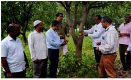
औरंगाबाद में विवाह को युवा शक्ति मंच की ओर से हिमायत बाग में पेड़ों को राखी बांधने का कार्यक्रम आयोजित किया गया। दूसरे छायाचित्र में 'प्रयास' ग्रुप की ओर से पेड़ों को राखी बांधते युवा।